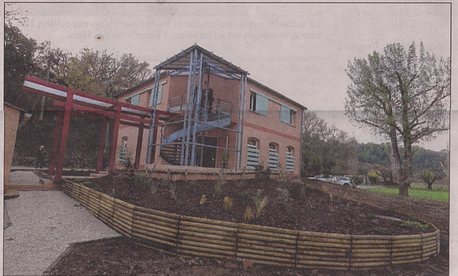
Le nouveau bâtiment est composé de six chambres au premier étage, une septième pour personnes à mobilité réduite au rez-de-chaussée où se trouve une salle de réunion.